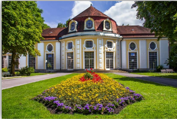
Wandelhalle in Bad Reichenhall